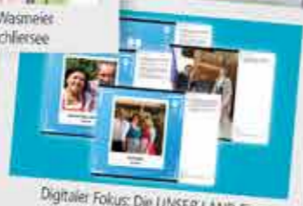
Digitaler Fokus: Die UNSER LAND Eier auf Social Media im Oktober