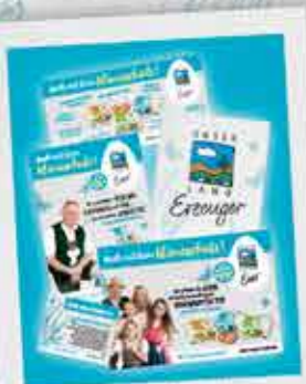
Spaß und Information: Neue Materialien rund ums Ei