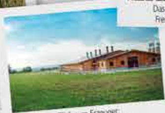
Blick zum Erzeuger: Hofeigene Klimaschutzprojekte