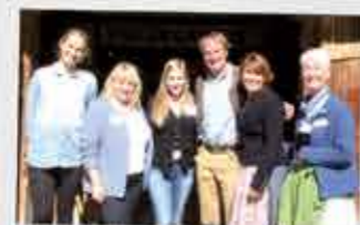
Das Ei und Ostern: Im Wasmeier Freilichtmuseum am Schliersee