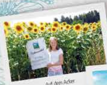
Auf dem Acker