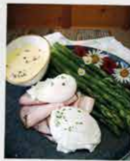
Das schmeckt: Neue Rezepte von der Hauswirtschafterei

Das beginnt bei der regionalen, gentechnikfreien Erzeugung und Verarbeitung der Futtermittel, geht über die Aufzucht der männlichen Küken und endet bei den nachhaltigen Projekten vor Ort (z.B. Photovoltaik-Anlagen) der UNSER LAND Eierzeuger und der Einsparung von klimaschädlichen Treibhausgasemissionen durch die kurzen Transportwege der Eier. Zum Ende des Jahres kann Resümee gezogen werden: Das war das UNSER LAND Eier-Jahr 2022.