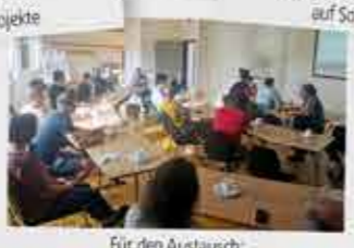
Für den Austausch: Eierzeugerversammlungen